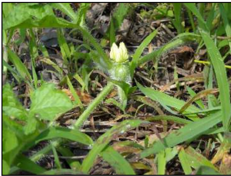
小さなスイカの実ができました